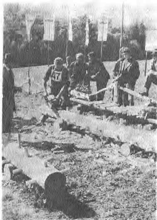
Сл. 4. — Кресање грана

У свим дисциплинама такмичар може највише освојити 850 бодова.