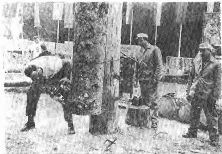
Сл. 3. — Потсецање стабла

Управно утврђен трупца са кором пречника око 40 см треба посјећи као у нормалном раду. Дубина подсјека је 10 см а угао засјека 35°. Равни подсјека треба да се пресијецају. Одређује се и смјер рушења стабла.