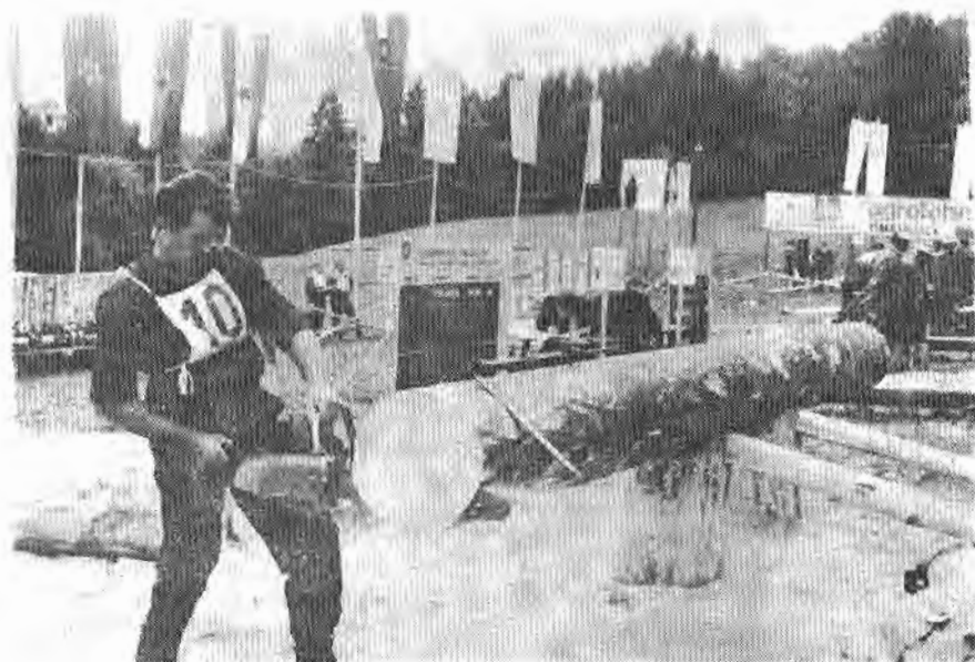
Сл. 2. — Комбиновани пререз моторном тестером

На радној висини од око 60 cm мјерено од хоризонтално постављеног трупца пречника око 40 cm, треба одрезати котур и то до половине одоздо а од половине одозго. Средина је обиљежена траком ширине 3 cm. Оба реза треба да се поклапају и да буду управни на осу трупца.