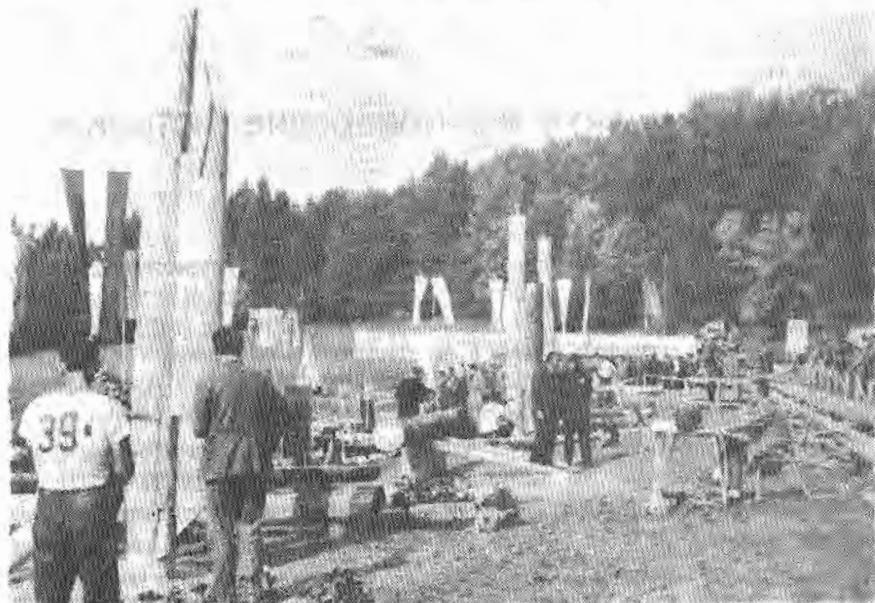
Сл. 5. — Такмичарски полигон

до сада су се одржала свега 4 успјела такмичења. Ово је може се рећи један од главних фактора за недовољно добар пласман, поред низа других. (Недостак нов. средстава, недовољно разумијевање и слаба сарадња радних организација и народне технике.)